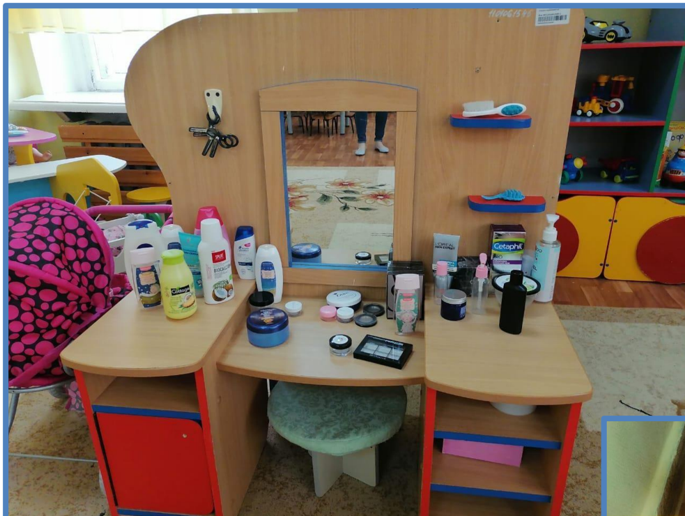
Центр сюжетно – ролевой игры «Салон красоты»