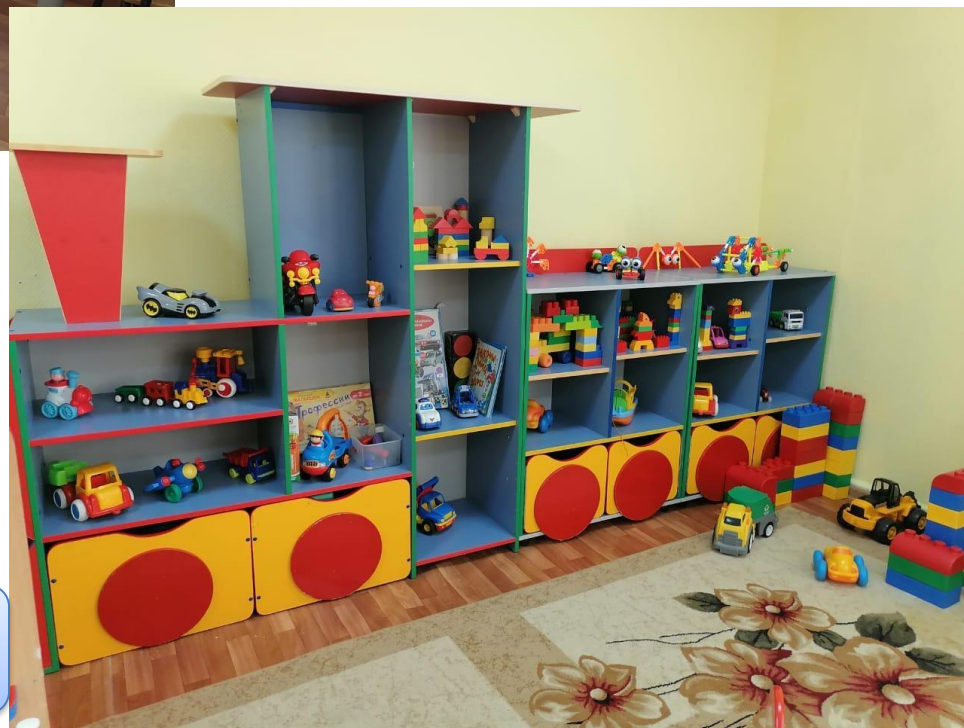
Центр «Винтик и Шпунтик»