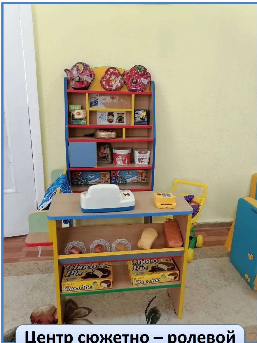
Центр сюжетно – ролевой игры «Магазин»