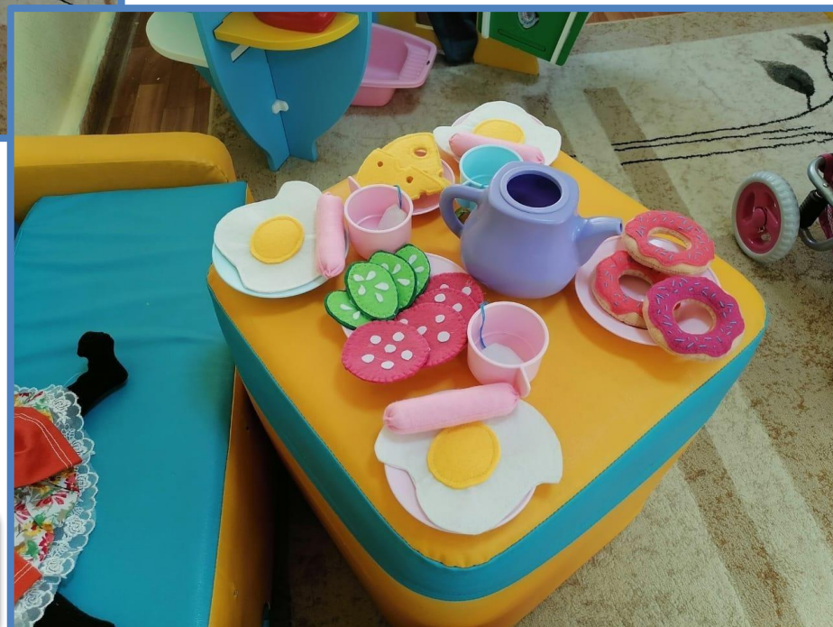
Центр сюжетно – ролевой игры «Дом. Семья»