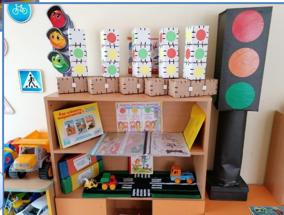
Центр «Знаем правила движения»